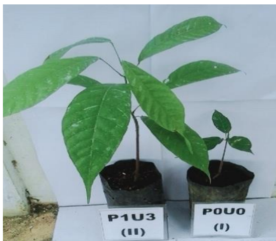
Gambar 2. Perbandingan bibit Siap Siap Salur ke Main Nursery