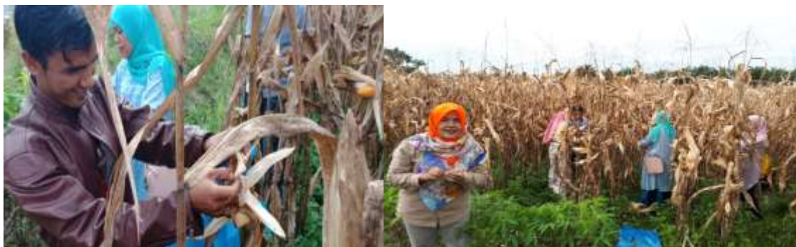
Gambar 2. Penetapan ubinan petak panen jagung

Pada gambar 3 dan 4 dapat dijelaskan bahwa ada hubungan diameter batang jagung terhadap diameter buah jagung berkelobot. Semakin besar diameter batang jagung akan meningkatkan ukuran diameter tongkol jagung. Dari gambar tersebut dapat dijelaskan bahwa ukuran batang sangat mempengaruhi ukuran tongkol dan berakhir mempengaruhi produksi pipilan kering jagung. Batang jagung yang lebih gemuk menunjukkan tingginya produk asimilat yang sudah ditumpuk tanaman dalam sel, dan akan ditranslokasi kemudian ke bagian buah atau tongkol setelah masanya tiba. Akan tetapi ini juga sangat ditentukan dengan tersedianya unsur hara di dalam tanah yang dibutuhkan oleh tanaman selama masa pertumbuhannya. Hal ini bisa dijelaskan jika diameter batang jagung cukup besar pada usia 1 bulan setelah tanam (BST), jika unsur hara kurang tersedia pada setiap fase pertumbuhan tanaman, maka produk asimilat hanya akan digunakan untuk memproduksi