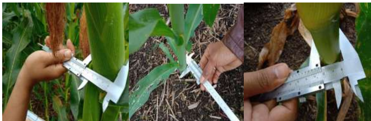
Gambar 4. Penetapan diameter dan batang jagung dengan menggunakan jangka sorong

Jika mengikuti rekomendasi nasional untuk tanaman jagung khusus di Lubuk Alung dalam 1 hektar berdasarkan kalender tanam terpadu BPTP Sumatera Barat (akses 27 Desember 2018) 359 kg urea; 100 kg SP36 dan 75 kg KCl jika tanpa bahan organik, kalau diiringi bahan organik 2 t ha -1 , 330 kg Urea; 100 kg SP36 dan 35 kg KCl. Jika mengikuti rekomendasi BPTP Sumatera Barat tanpa pemberian bahan organik maka biaya yang dikeluarkan hanya Rp.1.591.600,-. Dibandingkan pemupukan petani maka akan lebih hemat (Rp.1.995.000- Rp.1.591.600= Rp.403.400,-). Dari hasil pemupukan petani, terlihat bahwa takaran pupuk sudah sangat berlebih, khusus untuk pupuk SP36 dan KCl. Dari hasil wawancara petani memang mengabaikan kandungan hara apa saja pada setiap