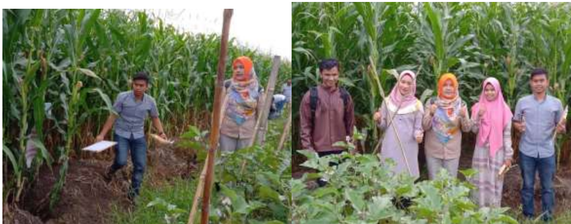
Gambar 1. Kegiatan pengumpulan data tanaman jagung di lapangan oleh tim pengabdian