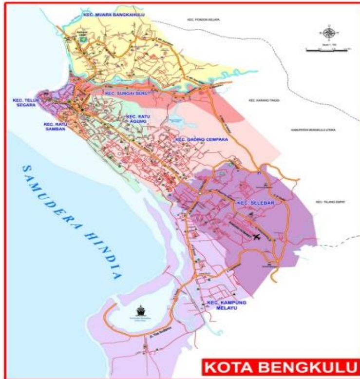
Gambar 1. Lokasi pengabdian