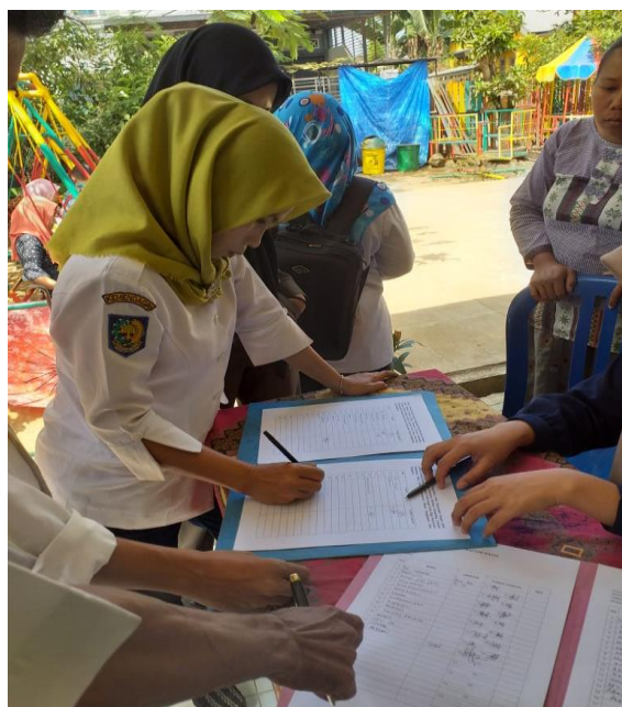
Gambar 4. Registrasi peserta pelatihan

Kegiatan pengabdian ini telah dilaksanakan pada tanggal 30 Oktober 2019 yang dihadiri oleh Bapak Lurah, Sekretaris Lurah, staf Kelurahan Rawa Makmur, guru-guru TK Rawa Makmur, Ketua RW, Ketua RT dan masyarakat Kelurahan Rawa Makmur yang berjumlah lebih kurang 30 orang, Kegiatan pelatihan diawali registrasi peserta seperti yang ditunjukkan oleh Gambar 4.