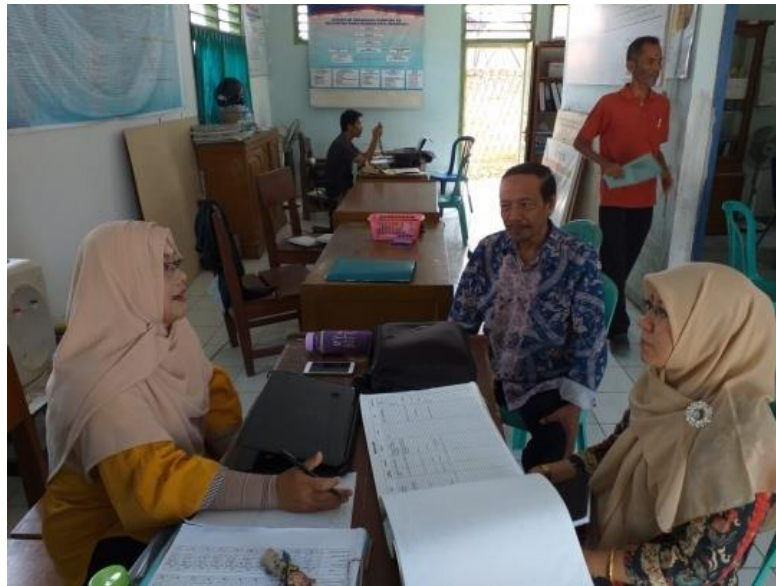
Gambar 3. Koordinasi tim dengan sekretaris Lurah Kelurahan Rawa Makmur Kota Bengkulu