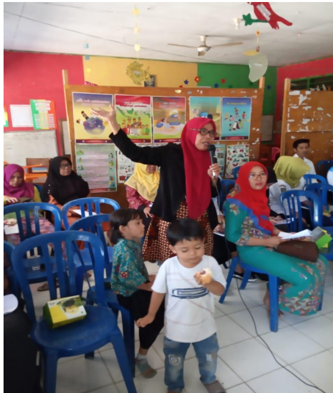
Gambar 5. Peserta sedang diskusi dan tanya jawab

Kegiatan mitigasi ini dapat dilakukan secara rutin melalui simulasi yang dapat dilakukan secara mandiri oleh khalayak sasaran secara rutin dan berkelanjutan. Tidak hanya pada saat ada pendampingan saja, sehingga mitigasi akan tertanam dan melekat menjadi sesuatu kebiasaan maka jika terjadi gempa saat sekolah berlangsung maka semua komunitas tidak lagi panik tetapi telah siap dan PRB dapat terlaksana dengan baik.