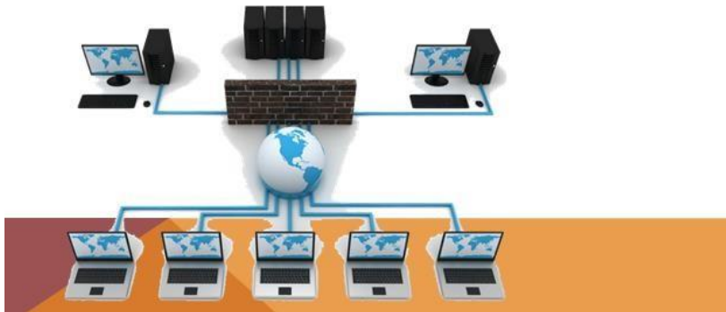
Gambar 1. Skema Jaringan Komputer